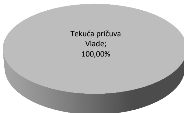
Graf 1. Struktura utroška sredstava tekućih pričuva u razdoblju 01.01.-30.06.2015. godine